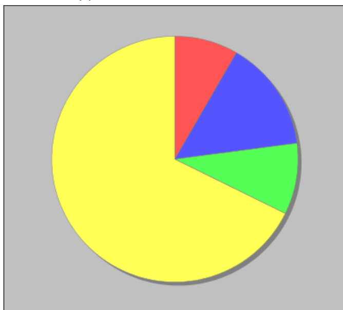
Distribuzione dei docenti a T.I. per anzianità nel ruolo di appartenenza (riferita all'ultimo ruolo)